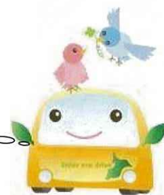
エコドライブキャラクター 「エコ丸くん」