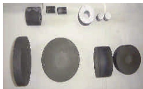
写真 1 焼結ダイ・パンチ・スペーサ