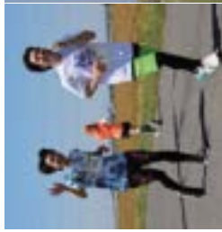
▲地域の景色を楽しみながら笑顔で走るランナーの皆さん