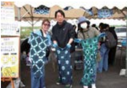
▲自分で模様つけをした世界に1つの藍染め手ぬぐい

神崎寺の伝統行事「火渡り修行」では山伏姿の修行僧が燃え盛る炎の中を裸足で駆け抜け、無病息災を祈念しました。