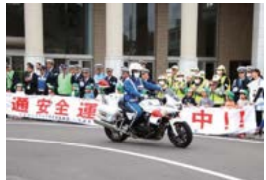
▲園児たちに見送られる白バイ

式典終了後には、白バイやパトカーなどの車両が隊列を組んで出発し、会場に集まった多くの来場者に見送られながら、地域の交通安全を呼びかけました。