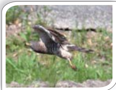
▲カエル、ヘビ、トカゲ、昆虫などを食べている

そこで『国際サシバサミット』を運営する日本のNGO 5団体が、3年前から渡りの全容解明調査に乗り出しています。