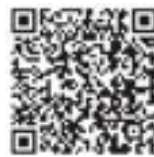
財産債務調書制度