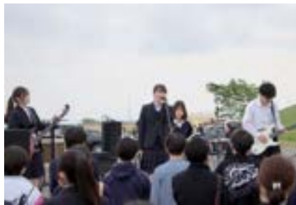
▲観客を引き付ける高校生バンドのライブ