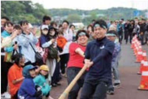
▲今年も大盛り上がりの綱引き対決

利根川河川敷を会場に「神崎河川敷祭」～こうざきリバーサイドフェスティバル～が開催されました。