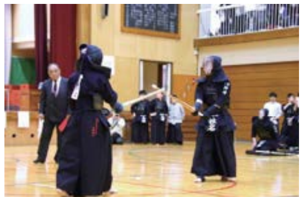
▲互いに間合いを測り、緊張感が高まる一瞬

選手たちは一戦一戦に全力で挑み、日頃の稽古で培った技と精神力を存分に発揮し、気迫あふれる試合が繰り広げられました。