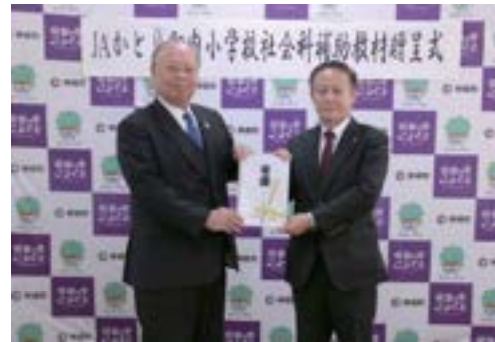
▲JAかとり武田代表理事組合長より贈呈