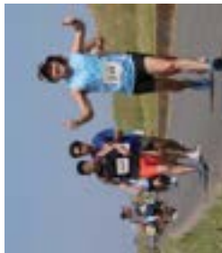
▲多くの参加者が藍染めTシャツで神崎町を駆け抜けました