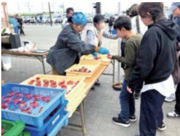
▲大盛況のいちごの無料配布

当日は、毎年恒例の甘酒・鯉こく・いちごの無料配布に加え、焼きそばやさつまいもスティックなどの販売が行われ、家族連れなど多くの来場者で活気にあふれました。また、地域の特産品にも触れられる機会となり、会場は終日、和やかな雰囲気に包まれました。