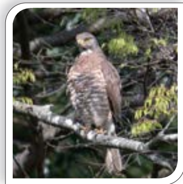
▲里山を生活圏にする猛禽（ワシ・タカ）の仲間