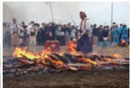
▲燃え盛る火の中を渡る山伏姿の修行僧