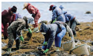
採貝藻漁業(ヒジキ)