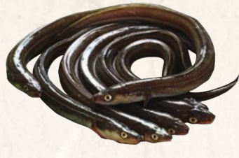
24 大佐和漁協江戸前あなご