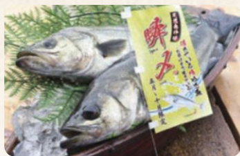
30 江戸前船橋瞬めすずき