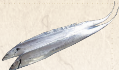
23 竹岡つりタチウオ