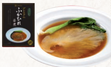
34 プレミアムふかひれ姿煮