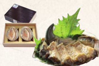
20 天然あわび海女の味噌焼き