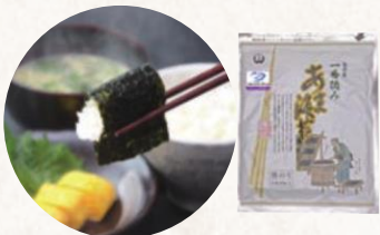
27 金田産一番摘みあま海苔(焼海苔)