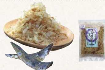
18 房州産鯖節・鯖花削り