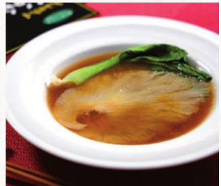
プレミアムふかひれ姿煮 有限会社ふかさく(銚子市)