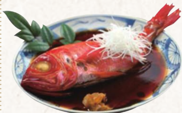
33 銚子つりきんめ姿煮 浜のかあちゃん仕立て