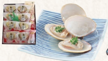
32 九十九里浜蛤酒蒸し