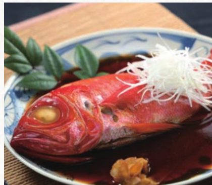
銚子つりきんめ姿煮 浜のかあちゃん仕立て 千葉県漁業協同組合連合会(千葉市)