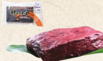
19 房州和田浦つち鯨