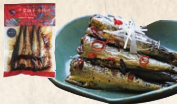
29 千葉銚子水揚げピリ辛いわし