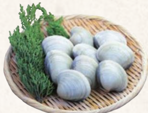
31 三番瀬ホンビノス貝