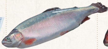
26 木更津おかそだちサーモン