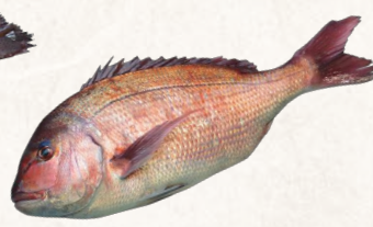
22 鋸南町勝山漁協養殖江戸前真鯛