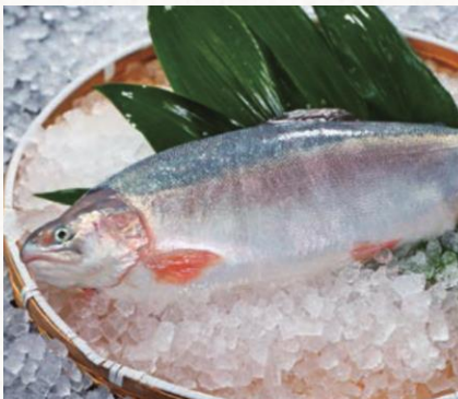
木更津おかそだちサーモン 株式会社FRDDジャパン(木更津市)