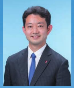
千葉県知事 熊谷 俊人