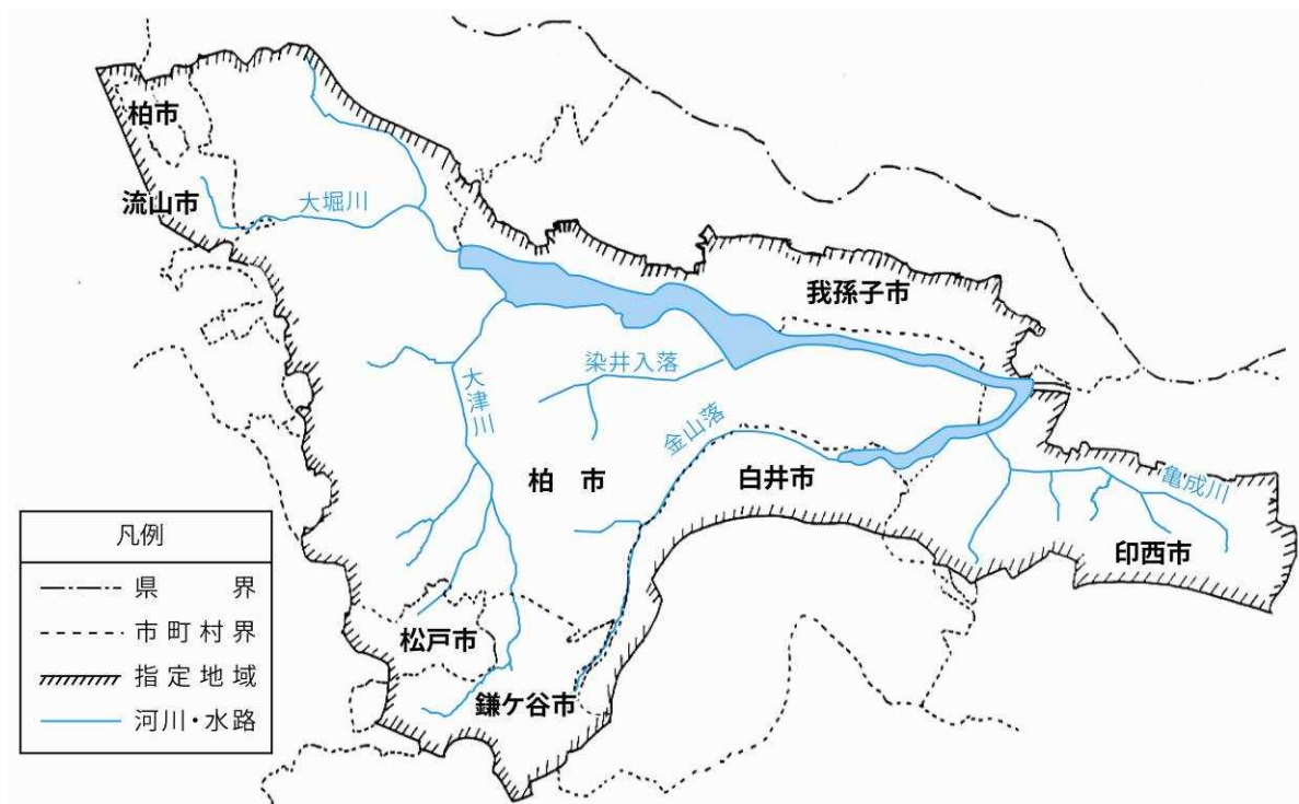
図 1 手賀沼・流域

手賀沼は千葉県北西部に位置し、その流域は7市にまたがり、流域面積は約144km 2 、約52万人が住んでいます。