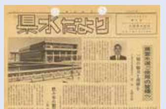
写真1 当時の千葉浄水場(右:高架水槽、左:1号配水池) 写真2 当時の栗山浄水場内の配水塔 写真3 県水だより第1号 写真4