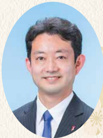
千葉県知事 熊谷 俊人