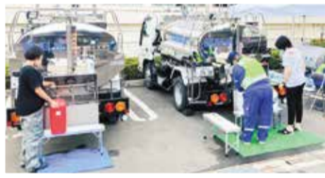
(静岡市への応急給水の様子)