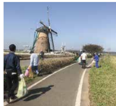
当局職員による清掃活動

同協議会ではこの他にもみなさまにご参加いただけるイベントをご用意しておりますので、水源保全のためにも是非ご参加ください。