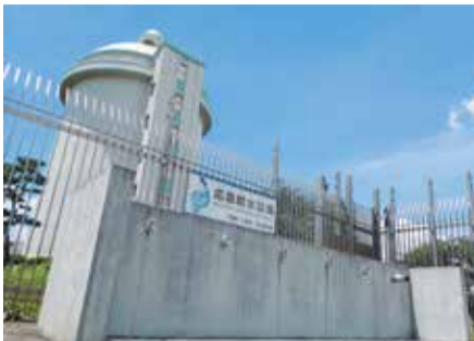
応急給水拠点(栗山浄水場)