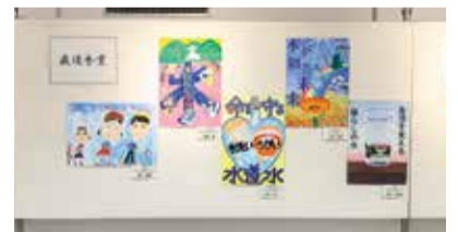
そごう千葉店(ポスター)の様子