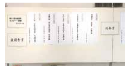
そごう千葉店(標語)の様子