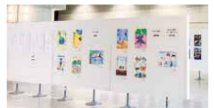
県立美術館の様子

千葉県営水道では、24時間365日安定して水道水をお届けするため、古くなった水道管を地震に強い耐震管に取り換える工事を進めています。近隣の水道管工事期間中はご迷惑をおかけいたしますが、ご理解、ご協力をお願いいたします。