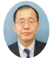
千葉県企業局長 山口 新二