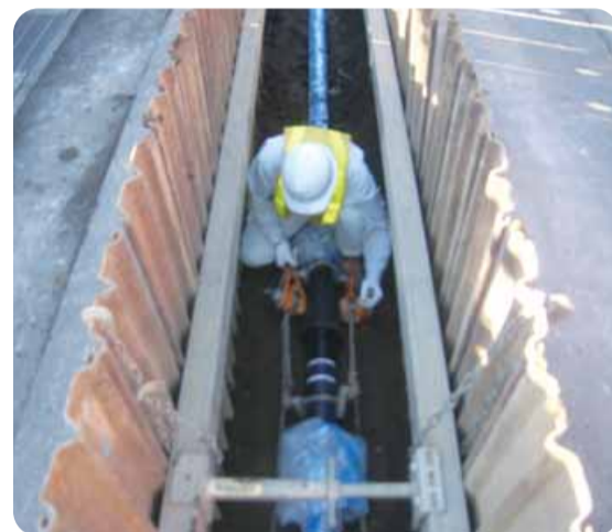
▲地震に強い管への取り替え工事

震災時に憂慮される漏水や断水の被害を未然に防ぐため、水道管の新設や、古くなった管の更新の際は、耐震管(地震時に継手部分が伸縮し、管が抜けるのを防ぐタイプの管)を取り付けています。