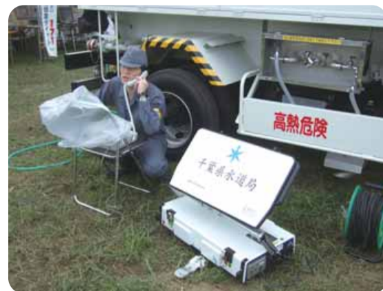
▶可搬型防災行政無線 (八都県市合同防災訓練にて)