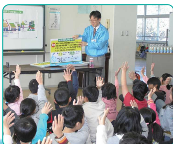
紙芝居や実験で楽しく学べる「水道出前講座」

水道局ホームページに「おいしい水づくり計画 オフィシャルサイト」を開設しています。計画の詳細もご覧いただけます。 http://www.pref.chiba.lg.jp/suidou/oishii/index.html