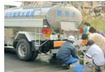
地震等の災害時にも、応急給水などに早急に対応できるよう、訓練を行っています。