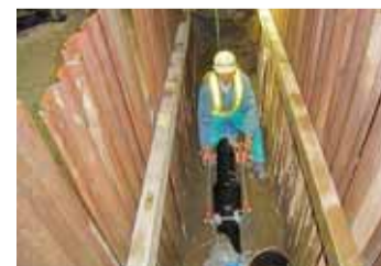
地震等の災害にも有効な耐震継手への取り替えを進めています。