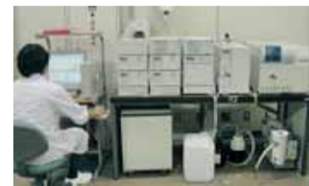
水道局では、24時間365日、休まず水質を管理しています。