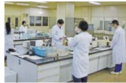
水質センターでの水質試験風景