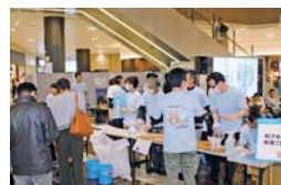
利き水を通して水道水のおいしさをPR