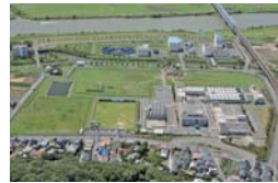
ちば野菊の里浄水場