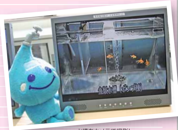
水槽をカメラで撮影し、モニターにより常時監視しています

浄水場に取り入れる水で金魚を飼って動きを常時監視し、もし金魚の様子がいつもと違っていたり、暴れたりした場合は取水を止めて、くわしく水質の検査をします。また、できあがった水道水でも塩素を消してから、同じように金魚を飼って、水道水の安全を見守ってもらっています。