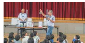
実験により消毒用塩素について学び子供たち