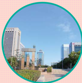
造成土地管理事業