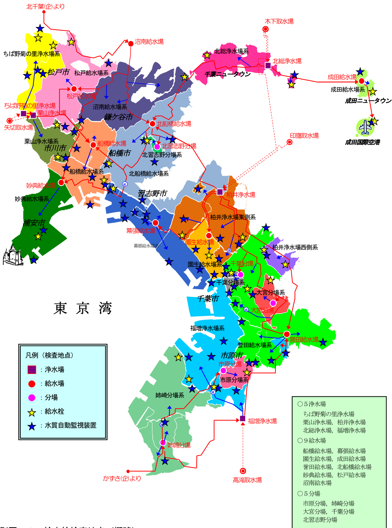
別図一 3 給水栓検査地点 (概略)