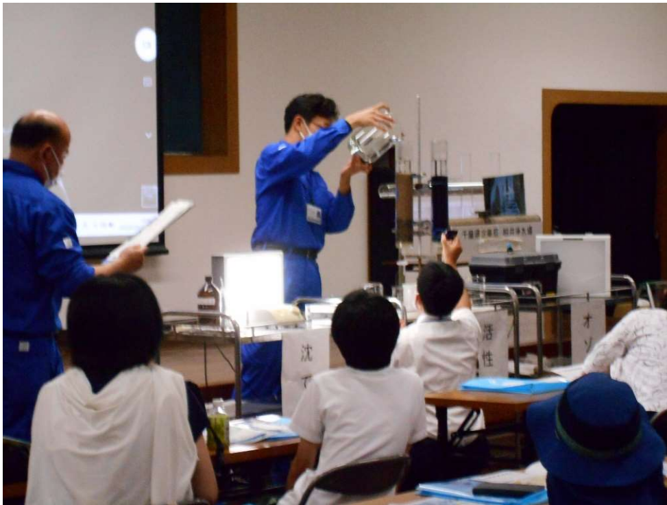
沈でん・ろ過実験