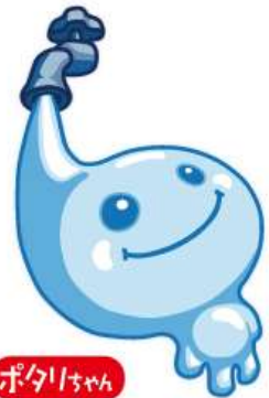
千葉県営水道マスコットキャラクター