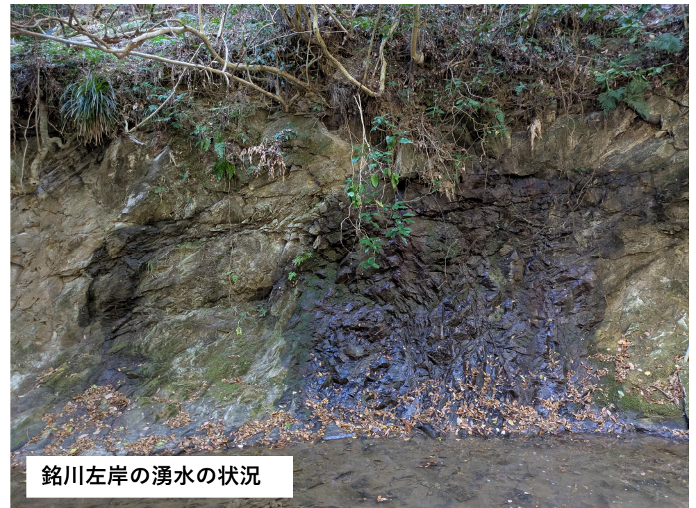
銘川左岸の湧水の状況