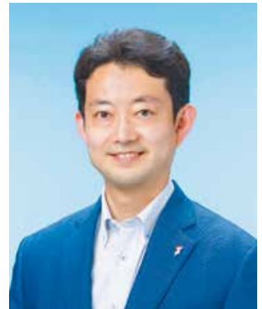
ちばアクアラインマラソン 実行委員会会長 President of the Chiba Aqualine Marathon Planning Committee