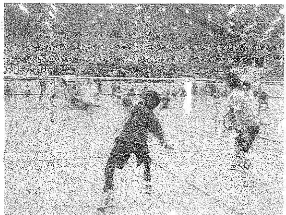
障害者と健常者によるダブルス戦の 1 コマ