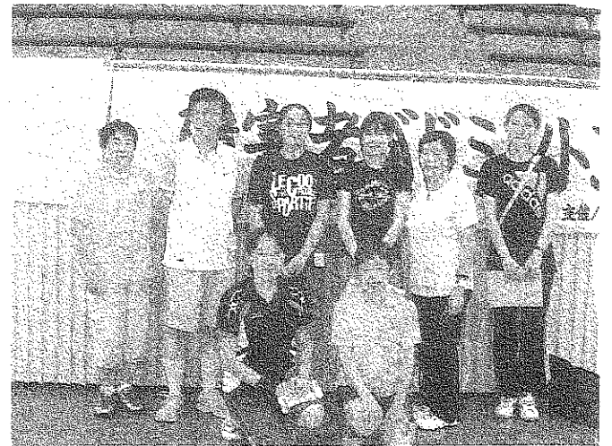
流山高等学園の先生及びサポーターの皆さん