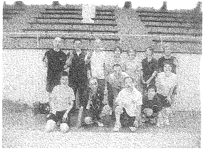
市原支部及びハートフルシャトルの皆さん