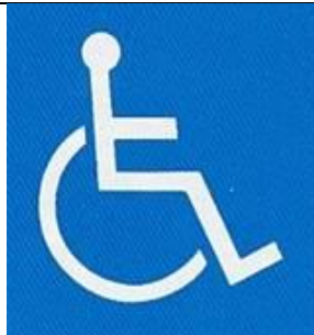
【障害者のための国際シンボルマーク】

所管：公益財団法人日本障害者リハビリテーション協会 障害者が利用できる建物や施設であることを表す世界共通のマーク。障害の種類や程度にかかわらず、すべての障害者を対象としたもの。 駐車場等でこのマークを見かけた場合には、障害者の利用への配慮が必要。