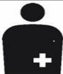
【オストメイトマーク】

身体障害者補助犬法の啓発のためのマーク。 身体障害者補助犬とは、盲導犬、介助犬、聴導犬をいう。「身体障害者補助犬法」では公共の施設や交通機関はもちろん、デパートやスーパー、ホテル、レストランなどの民間施設では、身体障害のある人が身体障害者補助犬を同伴するのを受け入れる義務がある。