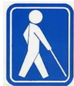
【盲人のための国際シンボルマーク】

政令で定める程度の聴覚障害のある人が免許を受けて運転する車に表示する 危険防止のためやむを得ない場合を除き、このマークを付けた車に幅寄せや割り込みを行った運転者は道路交通法の規定により罰せられる。