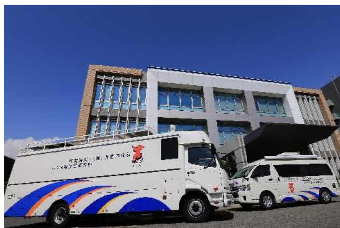
巡回歯科診療車(ビーバー号)