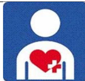
【ハート・プラスマーク】

所管:公益財団法人交通エコロジー・モビリティ財団 人工肛門・人工膀胱を造設している人(オストメイト)のための設備があることを表すマーク。 対応トイレや案内板に表示される。