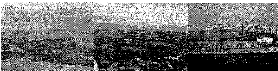
I - a 北総内陸区域 (印旛沼) I - b 銚子区域 (銚子市) II - a 京葉臨海区域 (千葉港)

本書では、これらの県土区分を基本として生物多様性を見ていくことにします。なお、「千葉県ビオトープ推進マニュアル」では陸域を対象としていますが、千葉県の生物多様性の特徴である干潟、浅海域、藻場、磯、サンゴ礁という変化に富んだ海域も含めることとします。