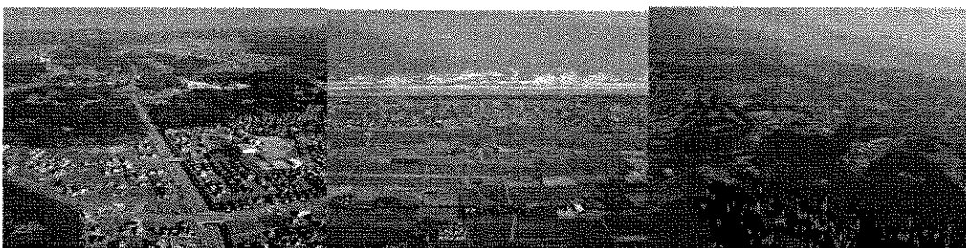
II - b 京葉内陸区域(木更津市) III - a 九十九里臨海区域(九十九里浜) III - b 九十九里内陸区域(大網白里町)