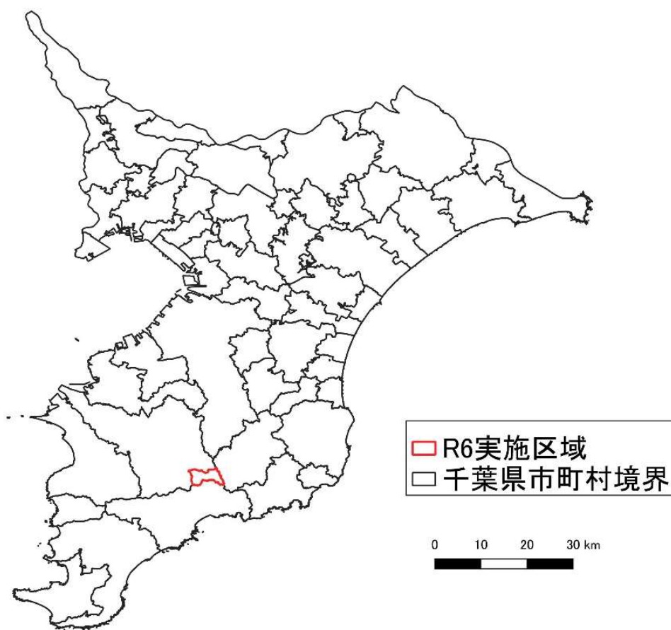
図1 実施区域図（全体）