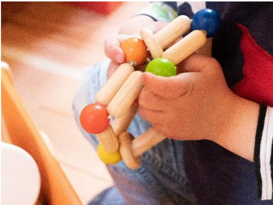
木のおもちゃで遊ぶ「おもちゃのチャペル」を運営し、木工体験等のイベントをおこなっています。