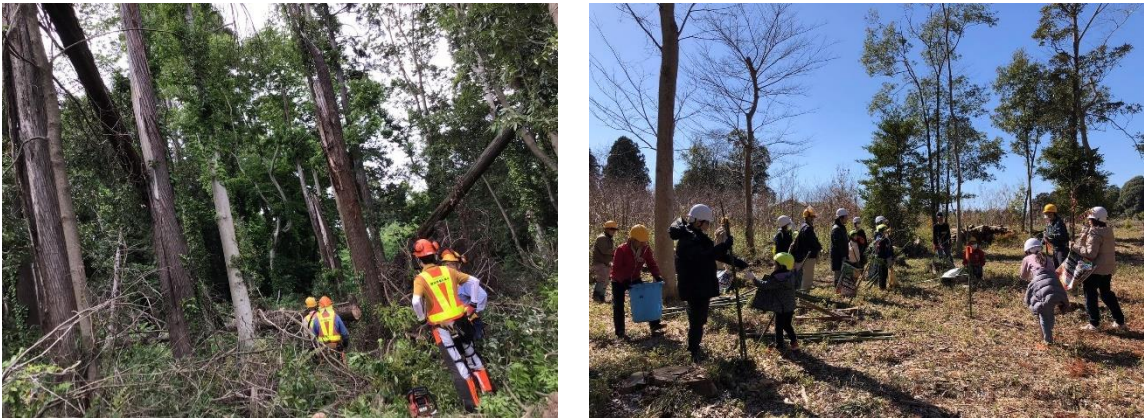
里山の森林施業を行うとともに、里山保全活動体験を開催し、子供や市民が里山に触れる機会を提供しています。

取組例 「森のスポーツパチンコ大会」の開催 【一般社団法人もりびと・森のスポーツパチンコ協会】