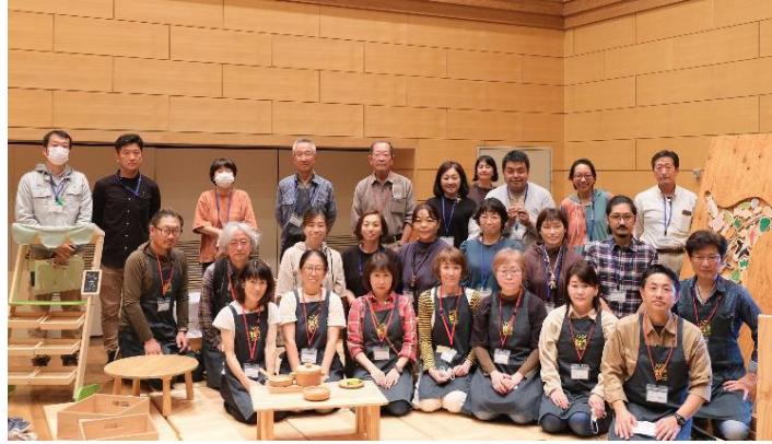
木育指導者養成研修受講者

県では、これまで指導者の育成を行ってきましたが、より木育を推進するためには、更なる人材の確保・活動の場が必要です。