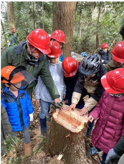
「ニッセの森」にて、親子が一緒に楽しく取り組み、森林や木材の良さを実感できる活動をおこなっています。