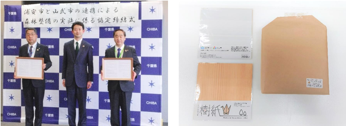
浦安市にて、1歳6カ月健診時に山武市産のサンプスギを加工した折り紙を配布しています。