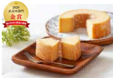
純米ぼうむ 「しっとりミルク仕立て」