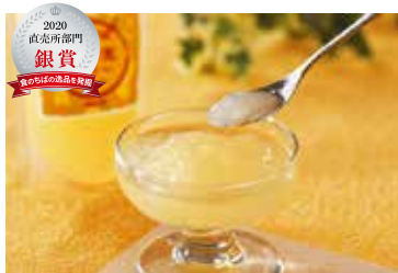
飲む ありの実ゼリー