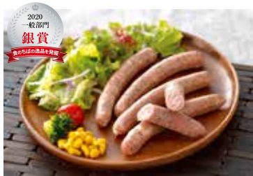
千葉県産いも豚 しそウインナー