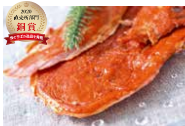
花悠 やさしいポークジャーキー

プレゼントは上記のいずれか1品が当たります。（商品の選択はできません。） プレゼントの「食のちばの逸品を発掘2020」については、以下の県ホームページをご覧ください。 https://www.pref.chiba.lg.jp/ryuhan/pbmgm/norin/torikumi/ippinn/