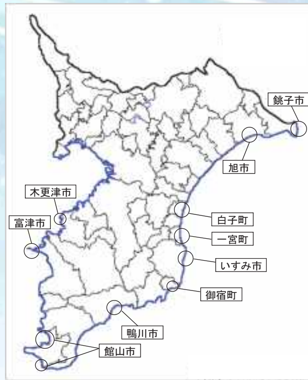
「千葉県海岸漂着物対策地域計画」 重点区域地図