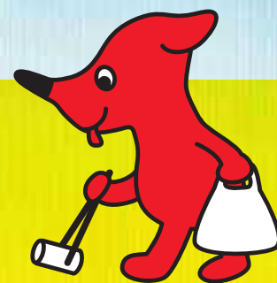
千葉県マスコットキャラクター 「チーバくん」

http://www.pref.chiba.lg.jp/shigen/kaigan/index.html