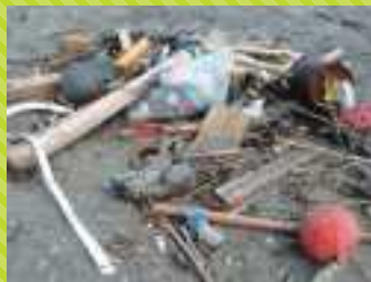
ビーチパラソル・サンダル・空缶・PET ボトルなど