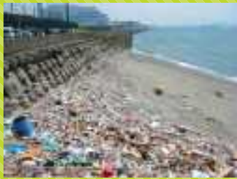
空き缶やペットボトルなど