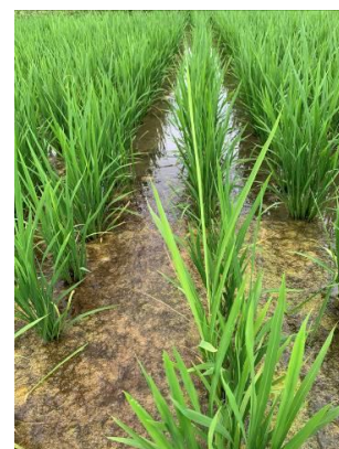
写真1 イネばか苗病

本田で発生したイネばか苗病の株を放置すると、孢子が飛び、周りのほ場にも伝染します。特に、 採種ほ場の周辺で本病が発生すると、優良な種子の生産に支障をきたします。 本病の発生が見られたら、採種ほ場の 出穂前までに罹病株ごと抜き取り、田んぼから離して埋却処理するなどの対応について、ご協力をお願いします。