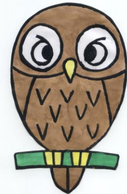
見守りふくろうさん

このリーフレットは、千葉県消費生活の安定及び向上に向けた県民提案事業「認知症でも安心して暮らせる地域を作ろうⅢ」の事業として作成しました。