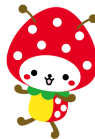
山武市マスコットキャラクター SUNMUSHIKUN