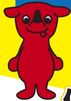
千葉県 マスコットキャラクター チーバくん