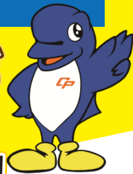
シンボルマスコット シーポック