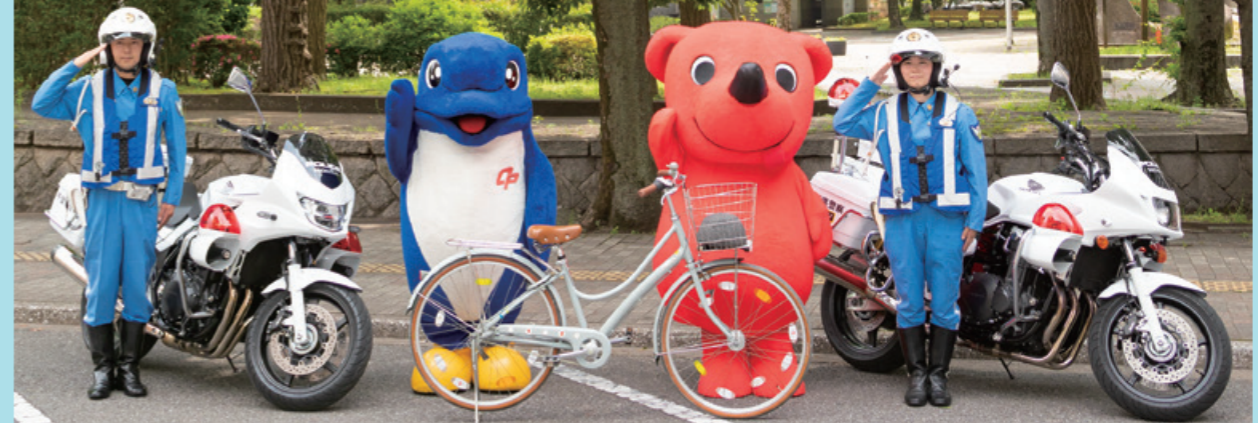
千葉県警察シンボルマスコット シーボック