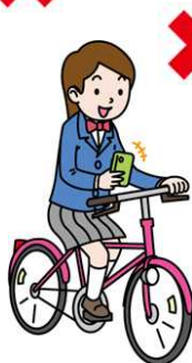
スマホ・携帯を操作しながら