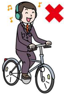
ヘッドホン等で 音楽を聴きながら