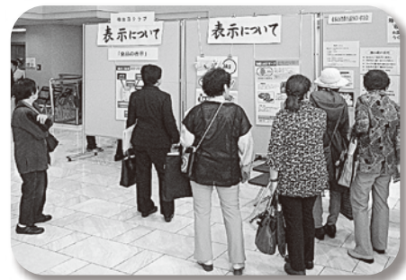
昨年の展示の様子