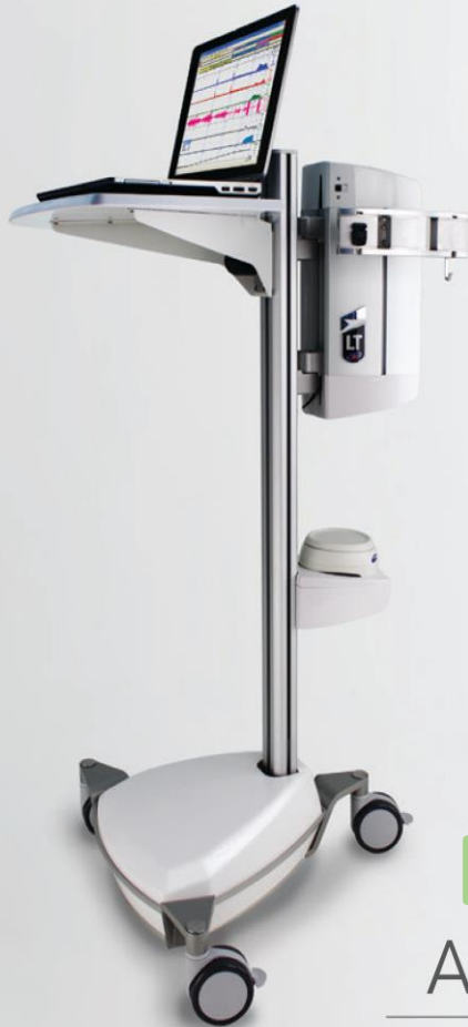
尿流動態検査装置