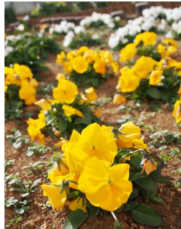
✽ボランティアの皆さんが 綺麗にしてくれています✽