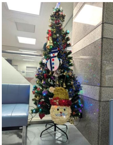
☆院内のクリスマス装飾☆