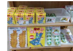
道の駅かわブラザにて販売されております

県内「イオン」様 銘店・和菓子コーナー、「県内わくわく広場」様、「スーパーランデル新松戸店」様、「道の駅みのりの郷東金」様、「ヨークフーズ 八柱さくら通り店・もねの里店」様、「カスミ フードスクエア成田赤坂店」様でお取り扱いいただいております。