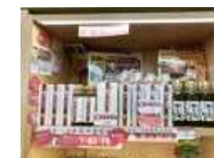
関越自動車道高坂SA上り線様 販売の様子

「亀山温泉ホテル」様、「京葉道路市川P A下り線」様、「J A市原市果彩菜 ちはら台店」様、「道の駅 免野の里ことうさぎ」様、「道の駅 みのりの郷東金」様、「道の駅 あずの里いちほら」様、「道の駅 多古」様、「道の駅 やちよ」様、「館山自動車道市原SA下り線」様、「道の駅ながら」様、「タツノの森農産物直売所」様、「有限会社貼澤」様等で取り扱われております。