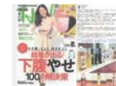
「日経ヘルス」8月号等で紹介されました

常磐自動車道 守谷SA下り線」様、「関越自動車道高坂SA上り線」様等で取り扱っていただいております。