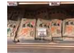
県外店舗の販売の様子

県内での販売実績 「イオン」様、「マックスバリュ」様、「マルエツ」様、「いなげや」様、「ナリタヤ」様、「道の駅八千代」様、「チーバくもん物産館 海ほたる店」様などでお取り扱いいただいております。