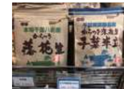
海ほたる様での販売の様子

県内での販売実績 「イオン」様、「マックスバリュ」様、「マルエツ」様、「いなげや」様、「ナリタヤ」様、「道の駅八千代」様、「チーバくもん物産館 海ほたる店」様などでお取り扱いいただいております。