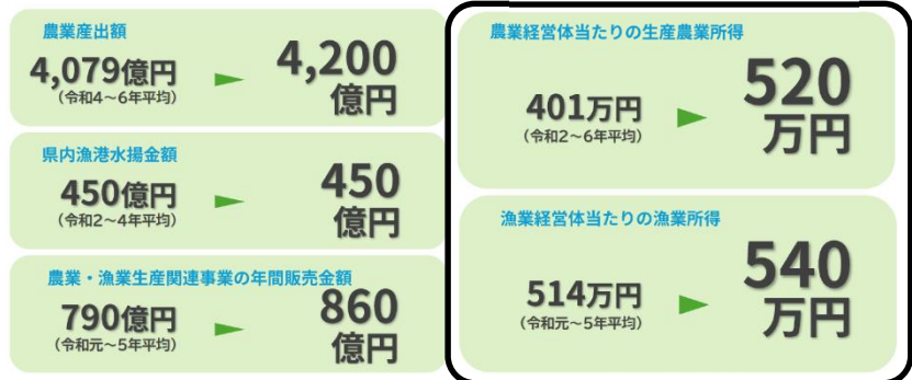
新たな「千葉県農林水産業振興計画」の数値目標

千葉県農林水産業振興計画掲載ページ https://www.pref.chiba.lg.jp/nousui/keikaku/nourinsuisan/s_hinkoukeikaku/r8.html