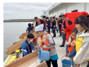
[大会記念リレー放流]