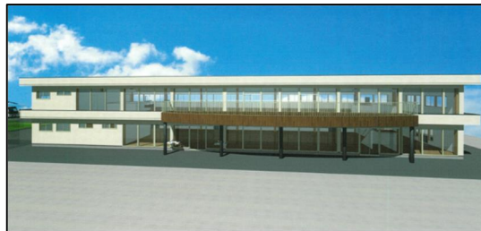
潮干狩り場休憩施設の整備 (完成予想図)