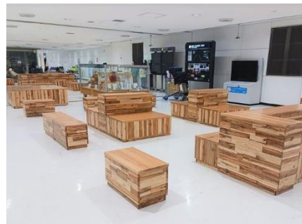
県産木材を使用した木製品