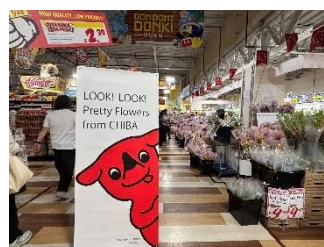
切花テスト販売(グアム)