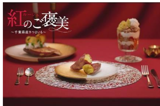
ルージュ 紅のご褒美 ～千葉県産さつまいも～