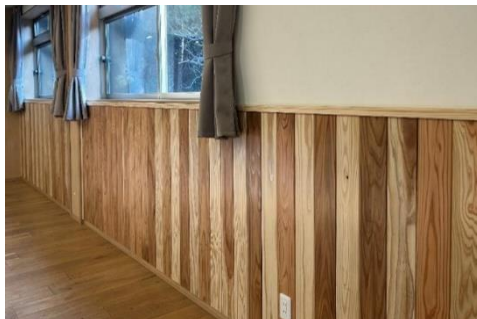
県産木材を使用した内装

令和5年3月に改定した「千葉県内の建築物等における木材利用促進方針」に基づき、建築物等への木材利用の促進を図るため、千葉県の建築技術者等を対象とした講習会を開催します。