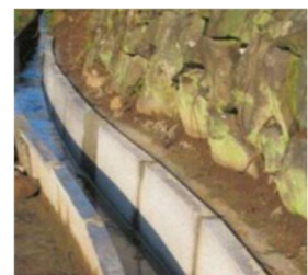
水路の更新 (資源向上支払・長寿命化)