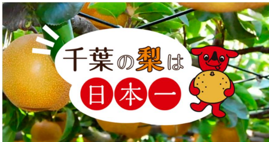
生産量日本一 ～千葉の梨～