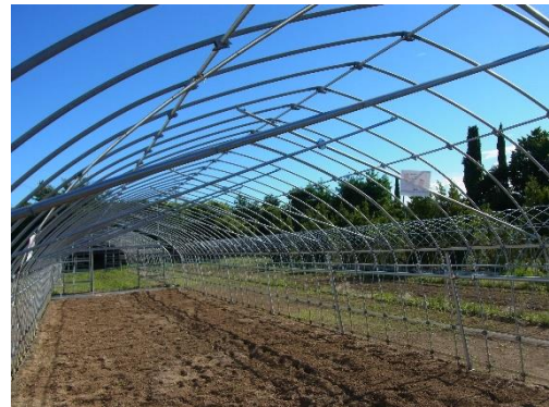
農業用ハウスの補強事例