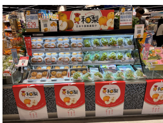
梨のプロモーション(台湾)

台湾での商流強化に向けて、現地でのプロモーション等を実施するとともに、輸出ターゲット国・地域での新たな販路開拓に向けて、生産・流通・販売の各段階に必要な支援を行います。