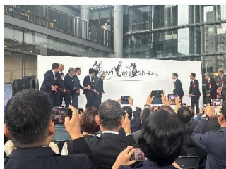
[1年前プレイベント(大阪府)]

[主な事業]・大会実施計画、宿泊・輸送計画等の策定 ・1年前プレイベントの開催 ・大会記念リレー放流の実施(稚魚の放流) 等