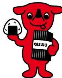
千葉県マスコットキャラクター