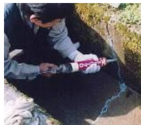
水路の補修 (資源向上支払・共同)