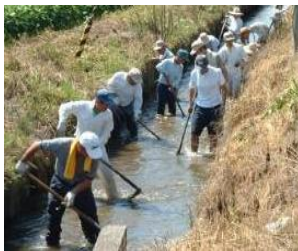
水路の泥上げ (農地維持支払)