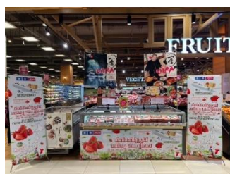
いちごテスト販売(カンボジア)