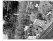
需要拡大のための植木見本園