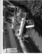
マルチを張りながら種子を播種する機械（シーダーマルチャー）