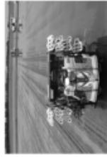
スマート農業で省力化と高度な栽培管理を目指す