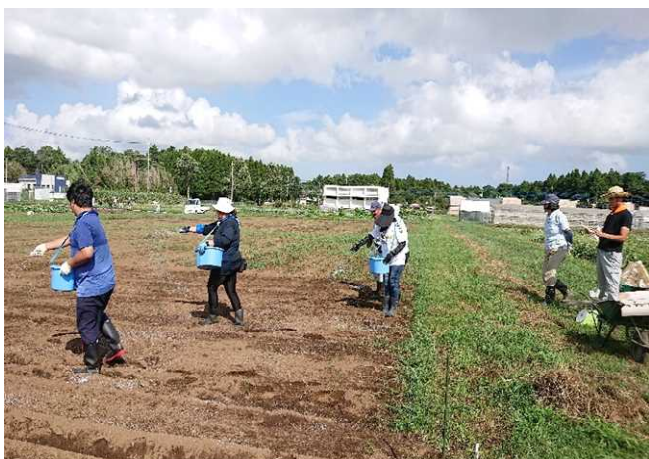
露地畑の施肥作業