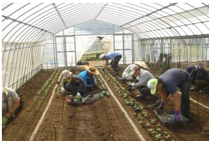
ストックの定植作業