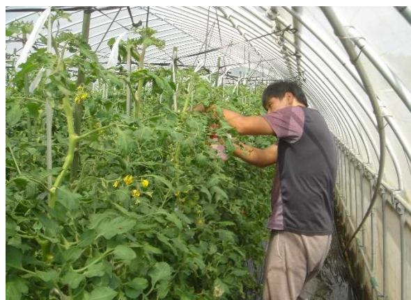
トマト栽培ハウス