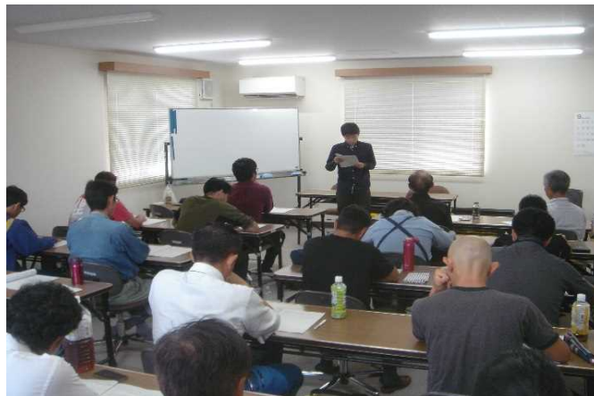
農家実習の報告会