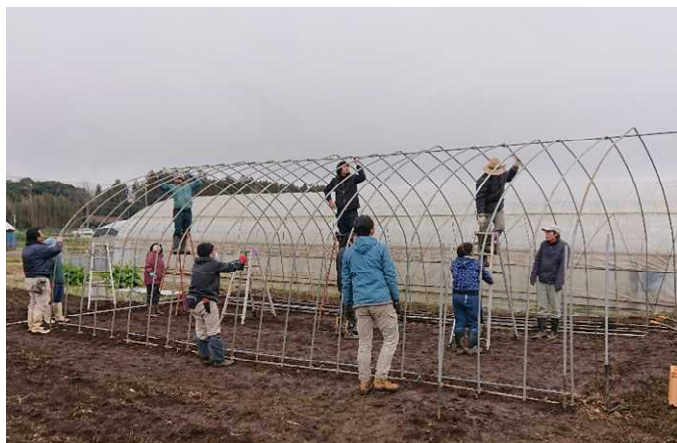
パイプハウスの組み立て実習