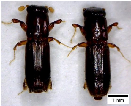
写真1 カシノナガキクイムシ成虫 左♂ 右♀