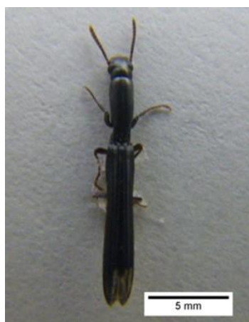
写真2 ルイスホソカタムシ成虫