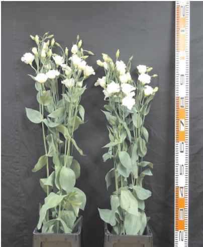
写真1 電照栽培が切り花品質向上に与える影響