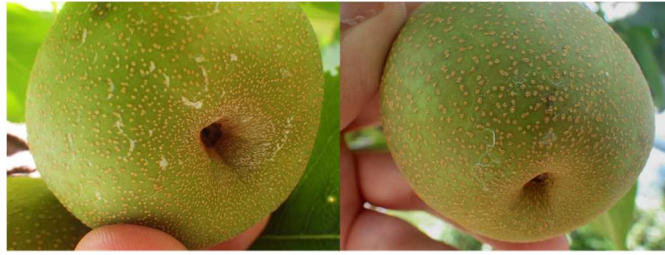
図1 オーソサイド水和剤 80 によるナシ「幸水」の果面汚れ