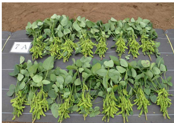
写真1 「おすすめ」（審査番号7）