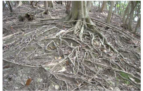
写真3 マテバシイ林の林床

急傾斜地で斜面下部に人家や道路がある場合は、伐採時に落石や伐採木の落下などの危険があるため、安全対策として下部に林帯を残すとともに、必要に応じて落石防護柵等を設置する。