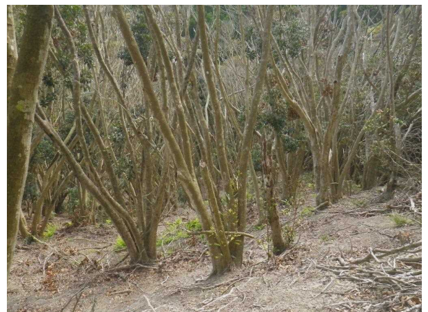
写真 4 集団的に枯死したナラ枯れ被害林の林内の状況