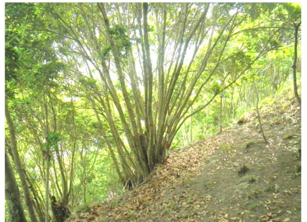
写真 2 伐採から 14 年経過したマテバシイの萌芽更新の状況

更新方法は、伐採した切り株から伸びる萌芽枝を利用する萌芽更新が一般的である（写真 2）。コナラなど、樹種によっては大径木化により萌芽更新が困難になることが知られているが、平成 27 年度に森林研究所が行った萌芽力調査では、マテバシイは切り株の径が 50cm 以下であれば萌芽更新が可能と考えられる。