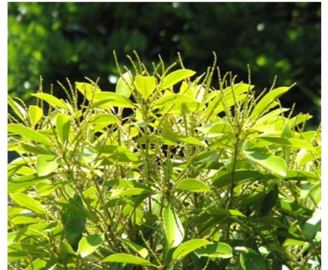
写真 1 マテバシイの新葉と雄花序